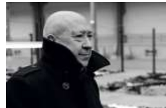
クリスチャン・ボルタンスキー