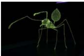
米谷 健+ジュリア《生きものの記録》2012年 展示風景：「MAMコレクション009：米谷 健+ジュリア」 森美術館2019年 撮影：木奥恵三