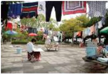
《感覚の洗濯 in 小名浜》2017