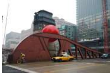
シカゴでの展示風景