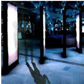
Illustration by MOE+