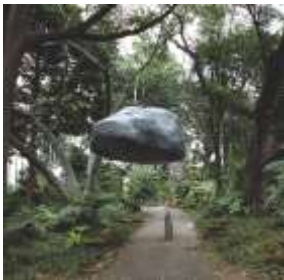
展示風景：ホルンレビエンナーレ2017