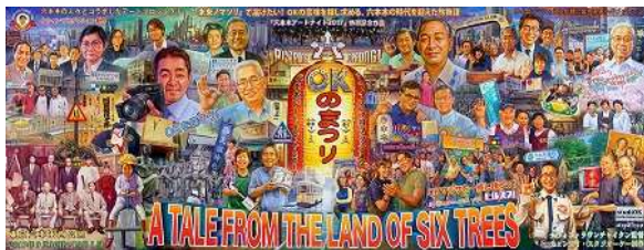
ナウイン・ラワンチャイクン《OKのまつり(六本木物語)》2017 所蔵：森美術館