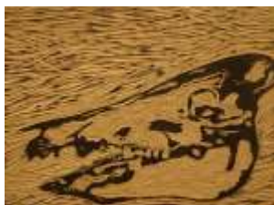
トロマラマ《戦いの狼》2006年 所蔵：森美術館、東京