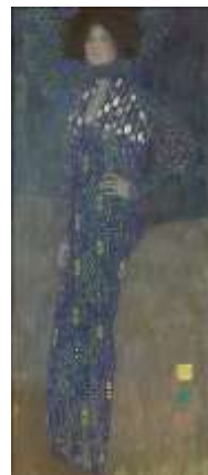
グスタフ・クリムト《エミーリエ・フレエグの肖像》1902年 油彩/カンヴァス 178 x 80 cm ウィーン・ミュージアム蔵