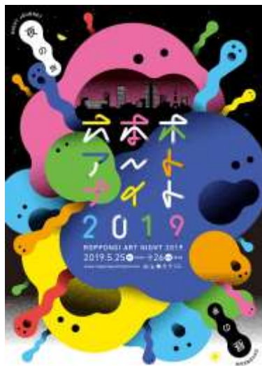
六本木アートナイト2019 メインビジュアル

2019年5月25日(土) 10:00～5月26日(日) 18:00 コアタイム：25日(土) 18:00～26日(日) 6:00