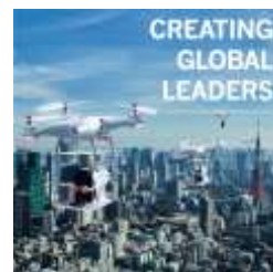
東京減点女子医大 2019年