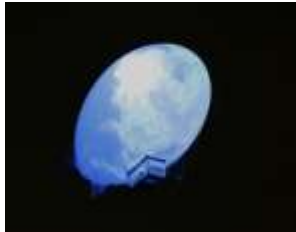
《GO FLIGHT AIRSHIP》2012