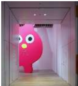
飯川雄大《デコレータークラブーピンクの猫の小林さんー》2019年 展示風景：「六本木クロッシング2019展」 森美術館