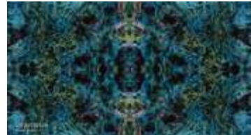
Undulation | Kouhei Nakama, 2018