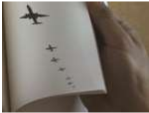
さわひらき《エアライナー》2003年 所蔵：森美術館