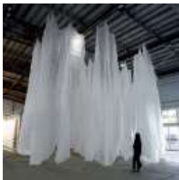
《untitled》2018 「水と土の芸術祭2018」(新潟)での展示風景