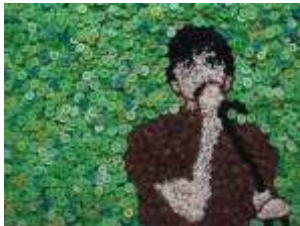
トロマラマ《ザー・ザー・ズー》2007年 所蔵：森美術館