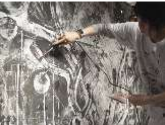
《白の訪問者》横浜高島屋