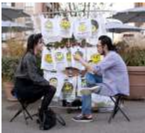
撮影：Yuriko Katori © Nobutaka Aozaki